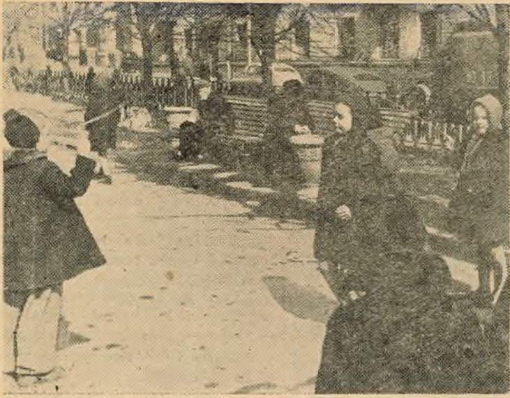
СОНЕЧНЫ ДЗЕНЬ